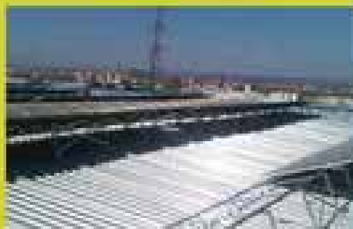
Fermina instal·lació de Som Energia a Lleida.

La suma de moltes persones pot generar una força imparable. L'objectiu de Som Energia és ser una cooperativa sense ànim de lucre que reuneixi a milers de persones amb el desig de canviar el model energètic actual i treballar junts per assolir un model 100% renovable.