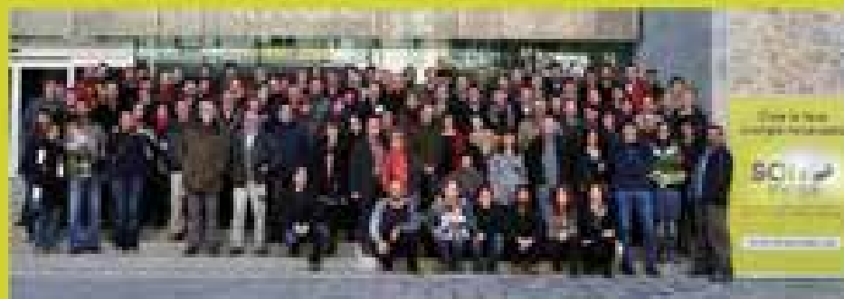
Foto de constitució de la cooperativa al desembre del 2010. Actualment ja som més de 2.000 socis i sòcies.